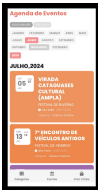
FIGURA 5 - PÁGINA DE EVENTOS DO MUNICÍPIO DE CATAGUASES.

A Figura 4, apresenta as categorias dos principais comércios da cidade de Cataguases.