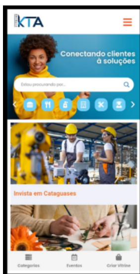
FIGURA 2 - PÁGINA INICIAL DO APLICATIVO.

A Figura 1, representa a ferramenta que foi utilizada para desenvolver o aplicativo VitrineKtá.