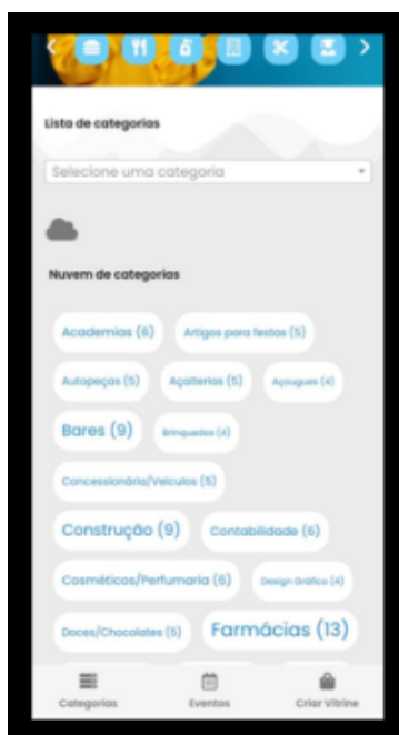
FIGURA 4 - PÁGINA DE CATEGORIAS DOS TIPOS DE COMERCIANTES.

A Figura 3, apresenta uma seção com os principais conteúdos que o usuário encontrará no aplicativo.